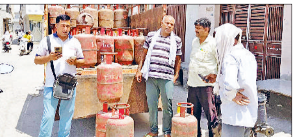
शहर में सिलेंडर की होम डिलिवरी के बाद गैस सिलेंडर लेने पहुंचे उपभोक्ता।

निर्णय नहीं लिया गया। इस कारण संबंधित कर्मचारी प्रमोशन, एसीपी सहित अन्य लाभों से वंचित हैं। कर्मचारियों ने आरोप लगाया कि अधिकारियों के मामलों का समाधान कर उन्हें प्रमोशन दिया जा चुका है, जबकि कर्मचारियों के मामलों में जबर्भाव किया जा रहा है।