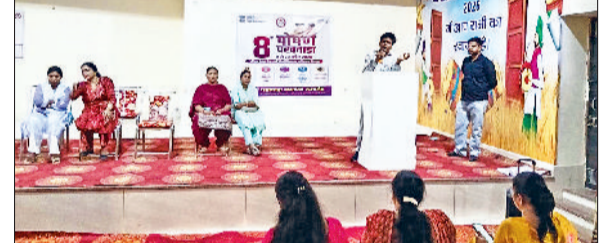
कैथल। विशेष योग प्रोटोकॉल प्रशिक्षण शिविर को संबोधित करते पदाधिकारी।