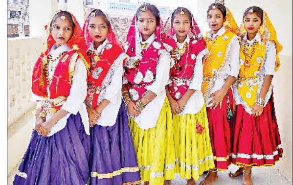
कैथल। हरियाणवी वेशभूषा में सर्जी छत्राएं।