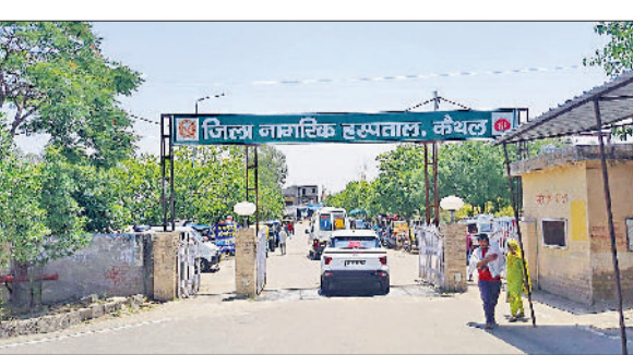
नागरिक अस्पताल कैथल

कैथल जिले के नागरिक अस्पताल में बच्चों का आईसीयू अब जल्द शुरू हो जाएगा। स्वास्थ्य विभाग ने प्रिंसिपल मेडिकल ऑफिसर के कार्यालय के साथ आईसीयू बनाने का कार्य शुरू कर दिया है। आठ बेड के बनाए जाने वाले आईसीयू के लिए अस्पताल में अवश्यक उपकरण पहुंच चुके हैं। वहां आठ बेड भी आ चुके हैं, जिन्हें जल्द ही यूनिट में लगाया जाएगा। अब ज्यादा गंभीर बीमारी से पीड़ित बच्चों के अभिभावकों को अपने बच्चों का