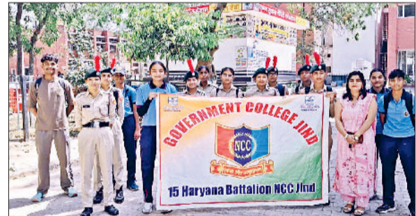
जीद। जागरूकता अभियान चलाए हुए छात्र।