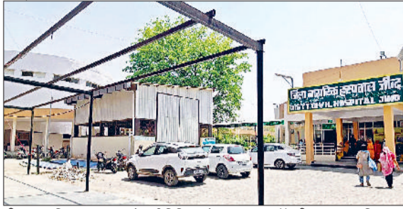
जींद। नागरिक अस्पताल में नई बिल्डिंग के पास बना ऑक्सीजन प्लांट, जिस पर ताते लगे हैं।