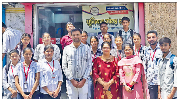
कैथल। बैंक का दौरा करते विद्यार्थी।