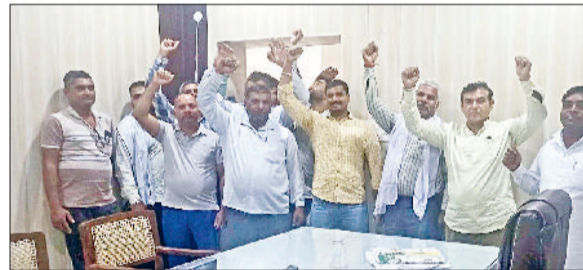
जीद। मांगों को लेकर नारेबाजी करते बिजली निगम कर्मचारी।

बिजली कर्मियों ने वीरवार को सिटी एसडीओ कार्यालय के सामने धरना देकर रोष प्रदर्शन किया। बिजली कर्मियों को आरोप था कि एसडीओ कार्यालय में न रहकर बाहर रहते हैं। जिससे कर्मियों तथा आमजन को परेशानी होती है। इस दौरान बिजली कर्मियों ने एसडीओ के खिलाफ जमकर नारेबाजी की। कर्मियों ने कहा कि निगम के आदेशों पर कार्यकारी अभियंता ने पत्र जारी कर साफ कहा हुआ है कि आफिस में बैठे टैरिफाल कर्मियों को फिल्टर में भेजा जाए। अधिक लोड होने के कारण फिल्टर कर्मियों को काफी परेशानी का सामना करना पड़ रहा है। बावजूद इसके एसडीओ