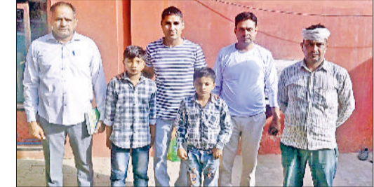
जीद। अभिभावकों के साथ गुम हुए बच्चे।