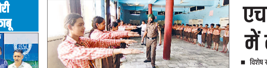
राजौद। एनसीसी चयन प्रक्रिया के दौरान मेडिकल जांच व फिजिकल टेस्ट में भाग लेते विद्यार्थी।

कैथल में प्राकृतिक खेती प्रशिक्षण एवं अनुसंधान केंद्र की स्थापना करने की मांग