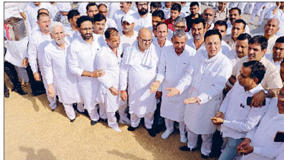
जीद। फसल खरीद का जायजा लेते रणदीप सुरजेवाला।