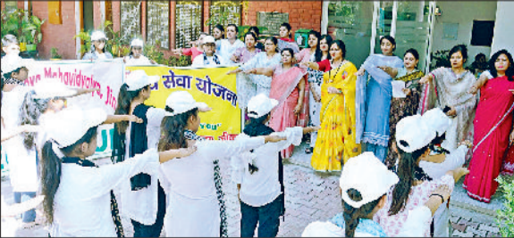
जीद। पर्यावरण को बचाने की शपथ लेते स्वयंसेविकाएं।