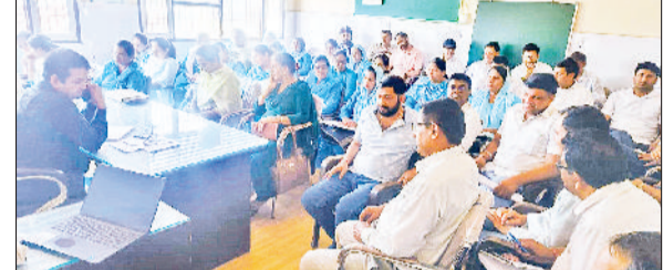
राजौद। सीएचसी में आयोजित बैठक में भाग लेते कर्मचारी।